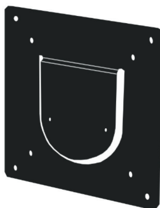
Адаптер крепления панели